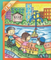
麥卓謙 愛群道浸信會呂碧碧鳳幼稚園