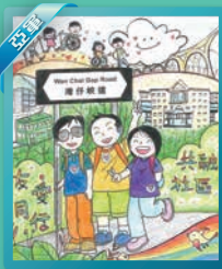
歐陽皓 軒尼詩道官立小學(銅鑼灣)