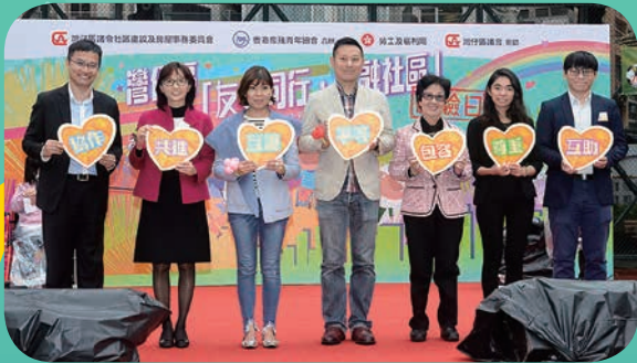
主禮嘉賓主持開幕典禮

由灣仔區社區建設及房屋事務委員會與香港傷殘青年協會合辦，勞工及福利局及灣仔區議會贊助的灣仔區「友愛同行·共融社區」體驗日活動，已於2月23日在灣仔修頓球場順利舉行。活動邀請到勞工及福利局副局長徐英偉先生，JP、灣仔區社區建設及房屋事務委員會主席李碧儀議員，MH、副主席鄭琴淵博士，BBS，MH、社會福利區東區及灣仔區福利專員葉巧瑜女士、灣仔民政事務助理專員劉希瑜女士、灣仔區議會活動觀察員張文嵩先生以及本會主席吳家榮醫生蒞臨主禮。