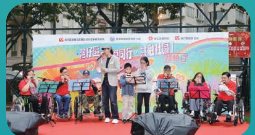
活動中心口琴組精彩演出