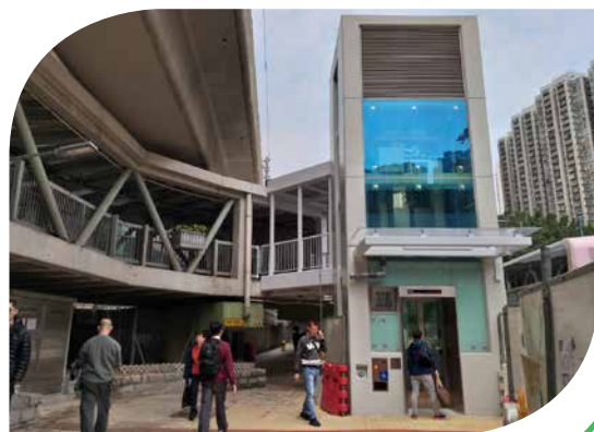
位置：觀塘道北行（九龍灣站B出口近巴士站）

連接九龍灣港鐵站B出口及彩盈邨，並橫跨觀塘道的的行人天橋 (KF128) 現已新增升降機，方便居住於得寶花園、彩盈邨、彩福邨及彩霞邨的居民往來九龍灣港鐵站、德福花園及九龍灣商貿區一帶。