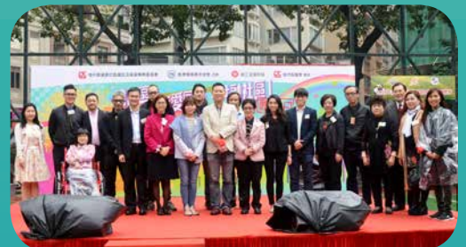
主禮嘉賓與各嘉賓合照留念