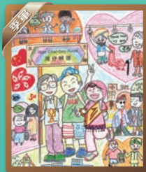
梁梵 軒尼詩道官立小學(銅鑼灣)