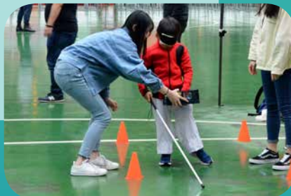
參加者體驗殘疾人士在日常生活中的挑戰

活動設有多個共融體驗項目，讓參加者體驗和了解殘疾人士在日常生活中的挑戰，透過親身了解讓參加者在日後願意以行動實踐傷健共融。是次活動以「友愛同行·共融社區」為主題，我們相信共融社區並不單只是殘疾人士或某一群體得到關愛便可，而是社區上每一個人都能得到對其固有尊嚴的尊重，這才能達致真正的社區共融。因此，活動亦邀請到來自不同社群組織，包括各復康團體、長者中心、青少年中心、婦女團體、兒童服務機構、少數族裔服務機構等支持和擔任共融遊戲攤位和進行展能表演。