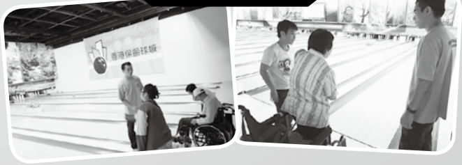
· 保齡球運動日 ·