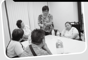
· 水果食用酵素工作坊 ·