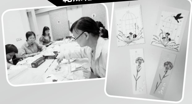
· 乾燥花書籤製作 ·