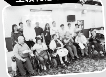
· 全賴有您晚會 ·