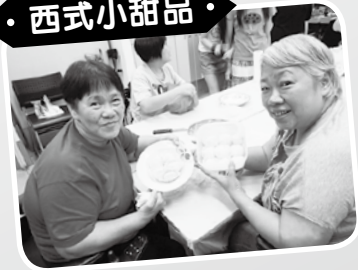
· 西式小甜品 ·