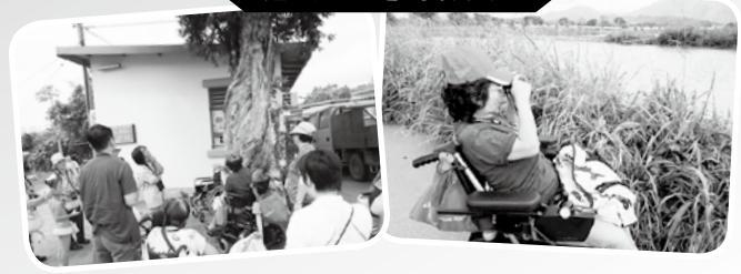
· 慧妍生態環保行 ·