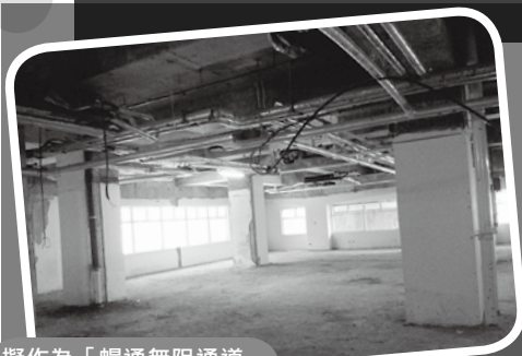
擬作為「暢通無阻通道」設施體驗館的地方