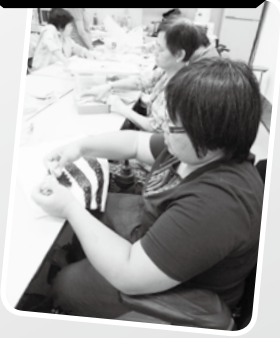
· 布藝環保袋製作 ·