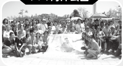
· 1+1 海洋公園 ·