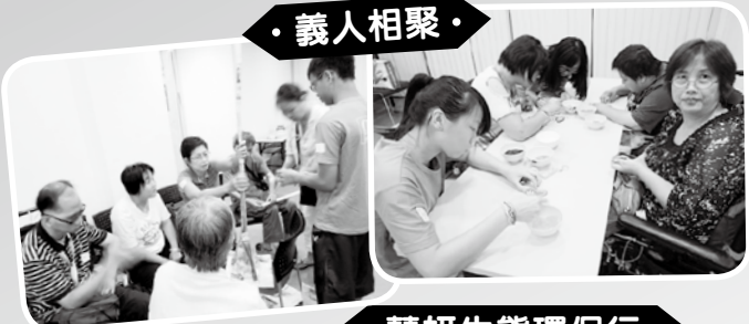
· 義人相聚 ·