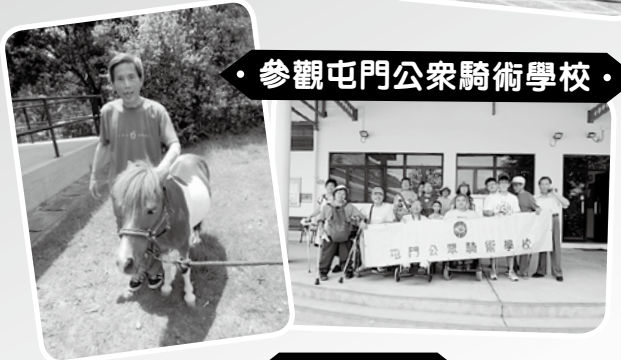
· 參觀屯門公眾騎術學校 ·