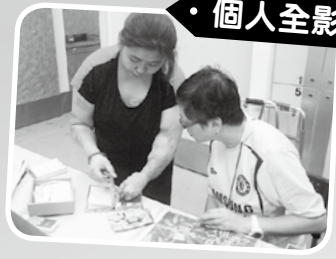
· 個人全影集 ·