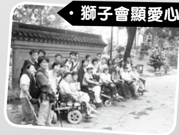
· 獅子會顯愛心 ·