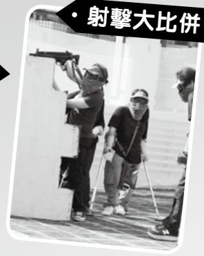
· 射擊大比併 ·