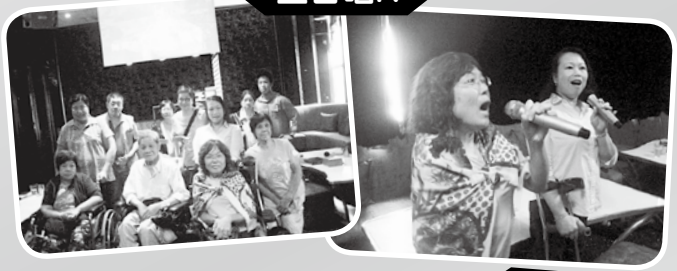
· 生日唱K ·