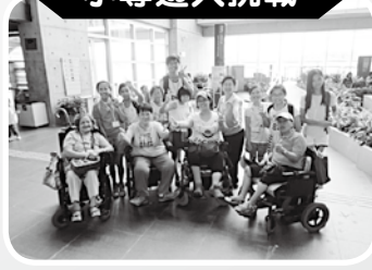
· 小導遊大挑戰 ·