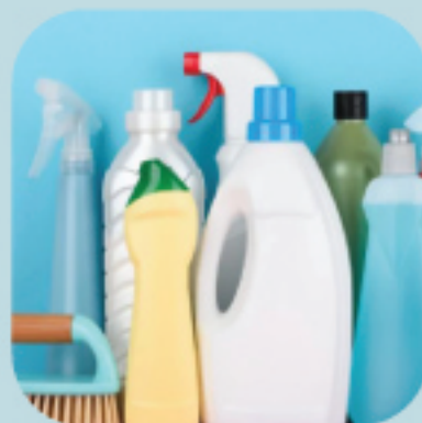
環境清潔及 個人衛生用品