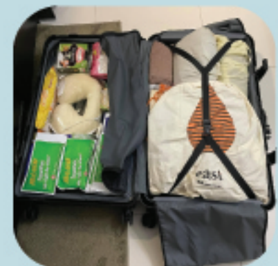
隔離/入院期間 需使用的必需品