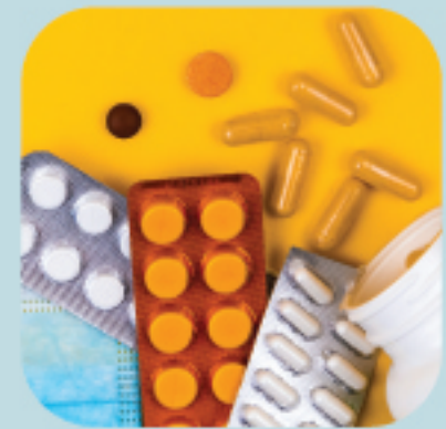
常用藥品/復康用品/ 長期病患所需藥物

一旦確診未必可以獲得即時支援，建議家中存備合適數量的必需品和日用品，於有需要時使用。