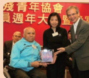
主禮嘉賓頒贈紀念品予柔力球義工組