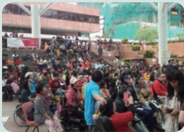
參加高峰會的人數眾多

委員會出席了2012年11月18日在香港理工大學舉行的殘疾人士高峰會。雖然這次為民間團體發起的高峰會，但當日參加的殘疾人士和家屬總數超過300人，而政府各部門的官員亦有出席聽取意見，當中包括勞工處、教育局等。透過今次的高峰會，殘疾人士直接向政府反映了他們的需要和要求，期望政府在日後推出的政策中會作出回應。