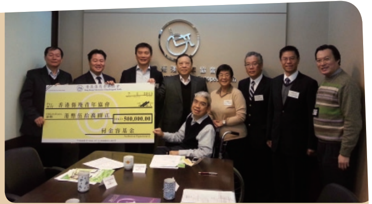
基金會議後委員大合照

此外，當天下午，舉行了何金容基金受惠者分享會。何金容基金受惠者均分享基金對他們的幫助，使他們的生活得以改善。三位何先生皆與受惠者交流。其中一位受惠者更送上感謝信，以感謝何金容基金管理及審批委員會的幫忙。