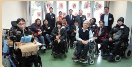
委員及受惠者大合照