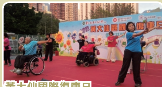
黃大仙國際復康日