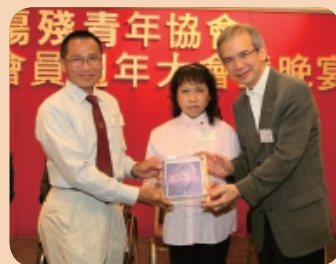
主禮嘉賓頒贈紀念品予傷青大使義工組