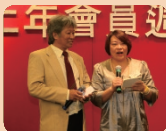
司儀宣佈週年晚宴開始