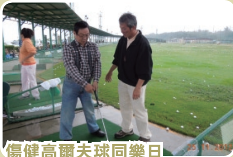
傷健高爾夫球同樂日