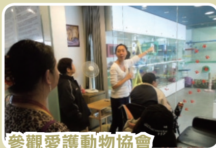
參觀愛護動物協會