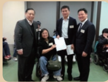
受惠者致送感謝信予委員