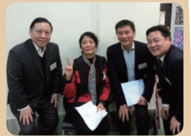
何金容基金委員與受惠者合照