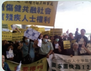
聲援動議的殘疾人士

梁耀忠議員在2012年11月21日在立法會提出「締造傷健共融社會」的動議辯論，促請政府成立專責委員會，推動及落實《殘疾人權利公約》，並擴大對殘疾人士的保障範圍，尤其是讓12歲以下的殘疾人士享有2元交通優惠。當日委員會主席及會員聯同其他殘疾團體一同在立法會聲援該議案，並要求各黨派議員支持。結果動議議案以大比數通過，本會促請政府盡快推出實際措施以落實《公約》內容。