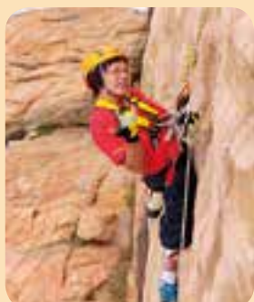
你睇你睇，放手擺Post都唔驚，So easy…