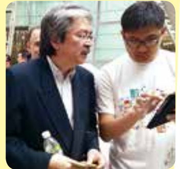
政策倡導主任向財政司司長介紹《無障礙去街Guide》

政府資訊科技總監辦公室於去年推出「數碼共融流動應用程式資助計劃」，並在眾多計劃書中挑選了七個機構開發有助不同社群需要的流動應用程式，本會的流動版《無障礙去街GUIDE》計劃有幸成為其中之一，並獲得是次計劃的數碼共融流動應用程式銅獎。