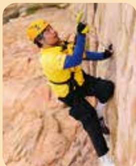
Wow… so easy!