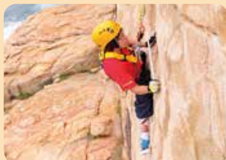
轉個正面俾你影相啦！