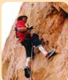
唔使緊張……就到地面啦！