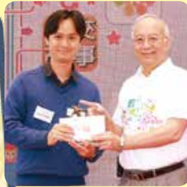
活動中心經理代表協會領取獎項