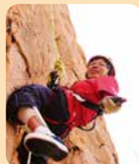
好易啫，難唔到我(心情好緊張)……