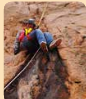
轉個正面俾你影相啦！