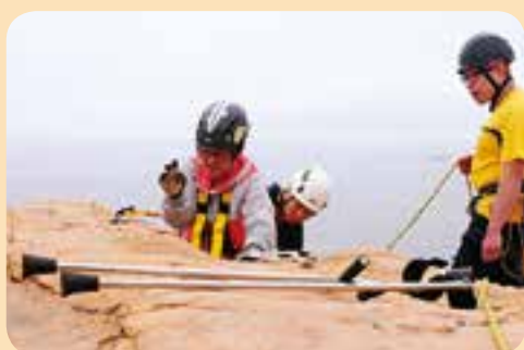
維Sir，呢D架生係咪真係保我安全架(等我檢查吓先！)