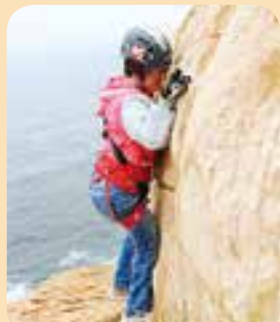
蜘蛛女落來保護你地……唔使驚，蜘蛛女係大廳！