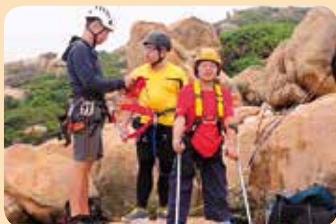
阿維Sir，唔好傾計啦！我已經準備好，得未呀？