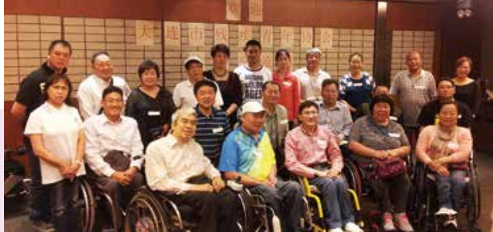
傷青會主席及理事會成員與大連市殘疾青年協會合照