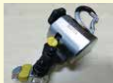
新式輪椅安全鎖 (使接載輪椅使用者 更為安全)