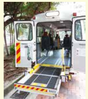
電動輪椅升降枱 (承重量有所提升)