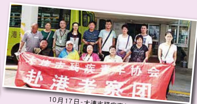
10月17日-大連市殘疾青年協會率領十多名團員到港考察