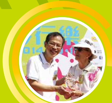
立法會主席曾鈺成太平紳士與 馬登夫人合照

傷青會於今日(2014年10月18日)早上10時30分再次舉行『健障行』-慈善步行樂2014籌款活動。是次活動邀請到香港特別行政區立法會主席曾鈺成先生及食物及衛生局局長高永文醫生擔任主禮嘉賓，主持充滿動感和特色的起步儀式。