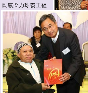
動感柔力球義工組