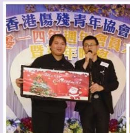
香港魔術同業協會表演