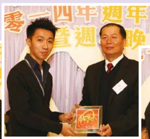
香港魔術同業協會