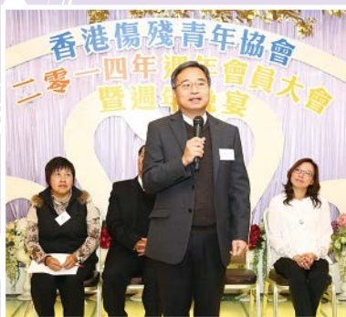
主禮嘉賓社會福利署助理署長 方啟良先生致辭