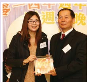
URS Hong Kong Limited