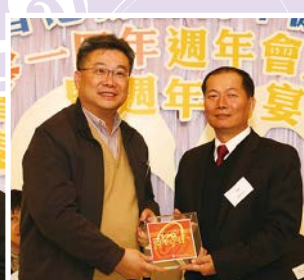
緯創香港有限公司