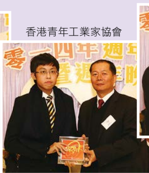
香港青年工業家協會