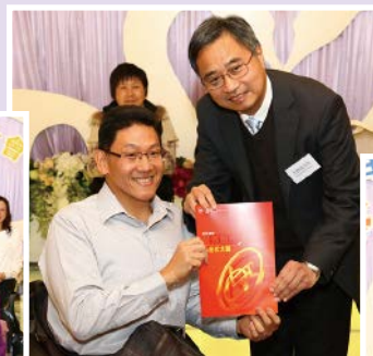
吳家坐式太極義工組