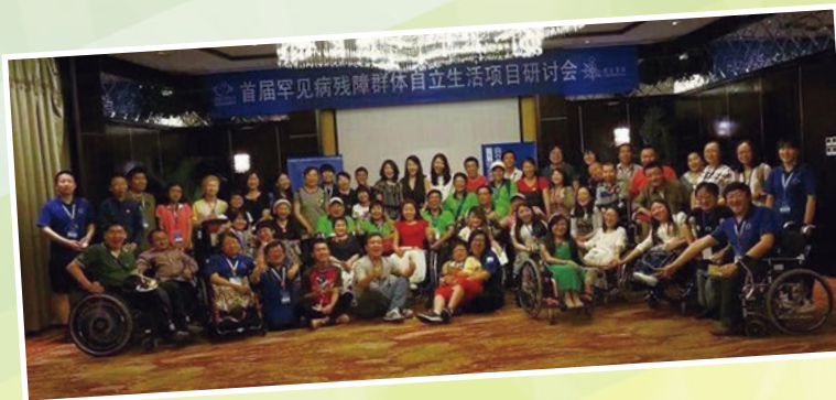
研討會主辦團體 - 北京瓷娃娃罕見病關愛中心代表與各與會團體合照。

傷青會期盼以上兩個活動能加強兩岸四地各殘疾人士團體的聯誼，並彼此之間的交流聯繫更為緊密。