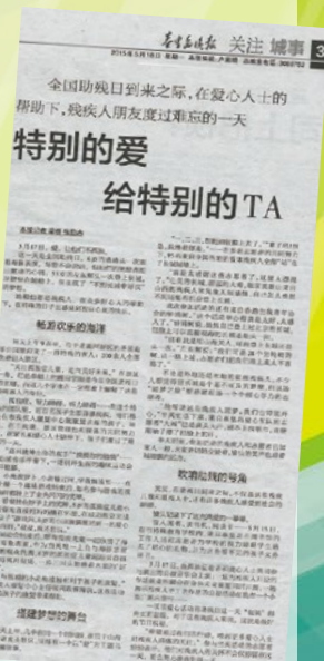
《秦皇島晚報》剪報二