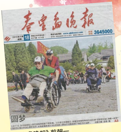
《秦皇島晚報》剪報一