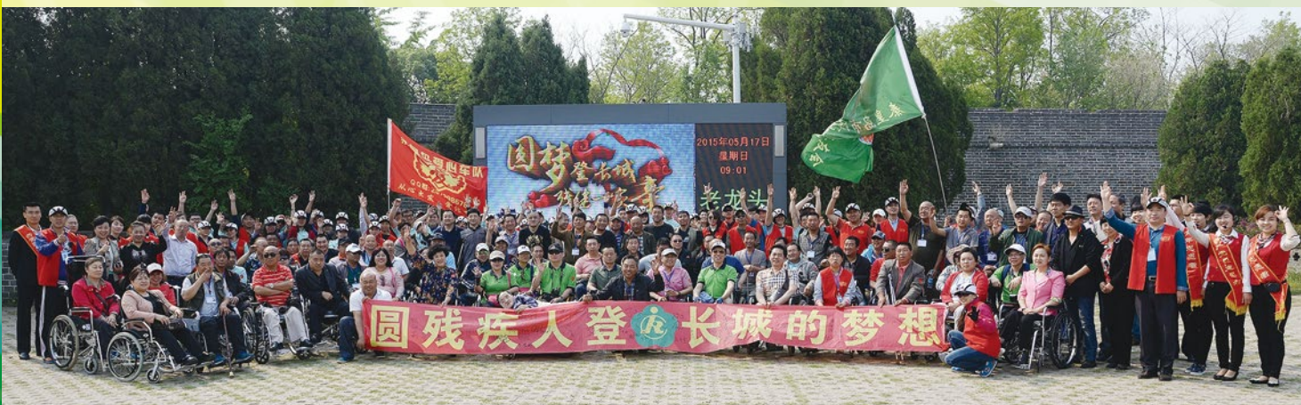
來自各地的殘疾人士雲集山海關，準備攀登萬里長城。