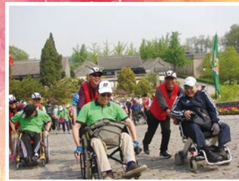
香港傷殘青年協會成員與來自各地的殘疾人士，在義工的陪同下一同攀登長城。