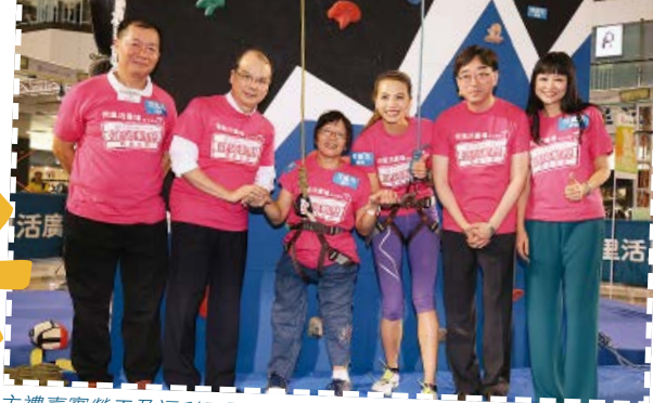
主禮嘉賓勞工及福利局局長張建宗先生、食物及衛生局局長高永文醫生、本會主席張偉良先生、健障系列籌委會主席龐愛蘭女士、攀登好手鄭麗莎女士及會員林艷紅女士