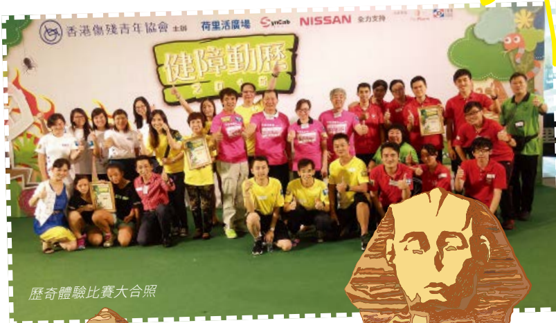
歷奇體驗比賽大合照