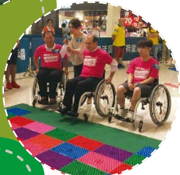
張建宗局長親身示範霹靂咁過沼澤

由香港傷殘青年協會主辦的「健障動歷」2015於8月20日至8月24日，一連五日在鑽石山荷里活廣場1樓明星廣場成功舉行。是次啟動禮邀請勞工及福利局局長張建宗先生及食物及衛生局局長高永文醫生擔任主禮嘉賓，主持充滿動感和特色的啟動儀式。