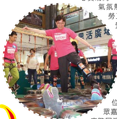
高永文醫生親身示範獨闖鱷魚潭與分享

啟動儀式完結後，本會邀請兩位主禮嘉賓作出體驗項目示範。在一眾嘉賓用吹氣棒的支持下，由張偉良主席陪同張建宗局長及一位殘疾青年鄭家豪先生坐上輪椅上一同參與「霹靂咁過沼澤」及龐愛蘭女士陪同高永文局長及一位殘疾青年嚴進一先生戴上膝部固定器共同完成「獨闖鱷魚潭」。兩位局長各自挑戰兩項體驗項目，並且順利完成。