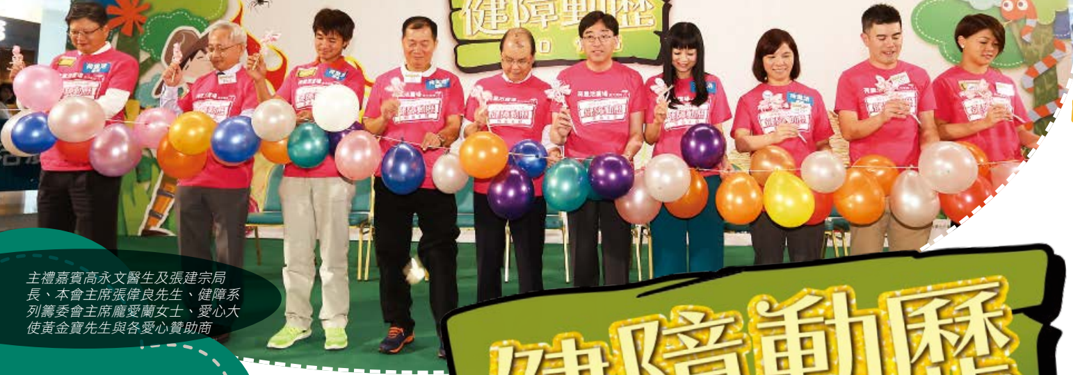
主禮嘉賓高永文醫生及張建宗局長、本會主席張偉良先生、健障系列籌委會主席龐愛蘭女士、愛心大使黃金寶先生與各愛心贊助商