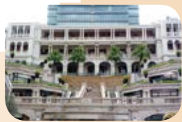
尖沙咀前水警總部