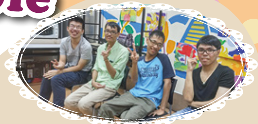
小組來到第七節， 組員雖然都帶著疲憊的身軀， 仍能保持燦爛的笑容

成長，伴隨著挑戰，思維，影響著行為， 把不可能的任務化為可能，改變故有的思考模式， 挑戰自我，成就更多的不可能，你們做到了，恭喜恭喜。