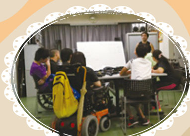
作戰會議進行中， 各隊員都非常緊張~!!