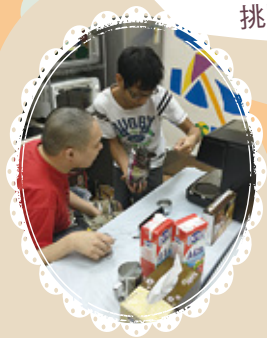
沖調一杯美味鮮奶咖啡 的第一3步：準備咖啡粉