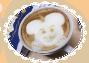
大功告成，大家又估唔估到 呢隻係咩來呢？^o^