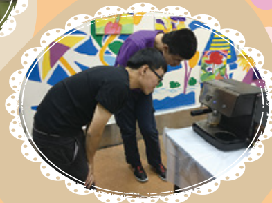
兩兄弟聚精匯神地 沖調咖啡中