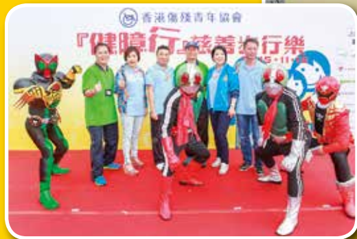
「正義的超人」與嘉賓大合照