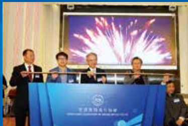
45週年起動亮燈拉桿儀式

香港傷殘青年協會45週年會員大會暨慈善晚宴已於2015年11月29日(星期日),晚上六時至九時三十分,在九龍灣啟德郵輪碼頭聯邦郵輪宴會中心順利舉行。是次慈善晚宴是傷青會45週年的重點慶祝活動,當晚的活動程序非常緊密和豐富。我們很榮幸邀請到香港特別行政區行政會議召集人林煥光先生GBS,JP及全國人民代表大會常務委員會委員范徐麗泰女士,GBM,GBS,CBE,JP擔任是次週年大會及晚宴的主禮嘉賓。此外,勞工及福利局副局長-蕭偉強先生,JP、社會福利署助理署長-方啓良先生及勞工及福利局康復專員-梁振榮先生,JP亦擔任45週年會員大會的嘉賓,一同見證本會邁向發展的新里程,勉勵本會繼續努力,再接再厲,為會員、為社會作出更多在復康服務上的貢獻。本會理事會主席張偉良先生在超過40位基本會員法定人數下宣佈舉行週年大會,扼要概述本會於過去一年在社區活動、就業服務、歷奇活動、社會企業及康復政策倡議工作上的成果及發展。