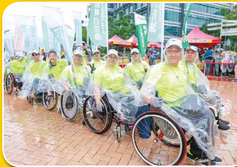
輪椅隊在起點整裝待發