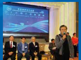
主禮嘉賓范徐麗泰女士致勉詞