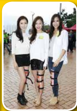
三位2015年度得獎香港小姐佩戴膝部固定器後合照