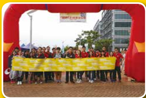
參加者於起點位置整裝待發