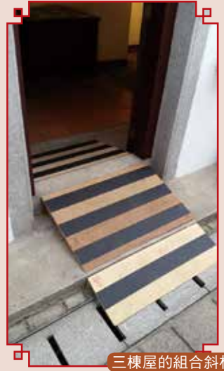
三棟屋的組合斜板

完成實地調查後，我們發現不少場地都有措施和設備協助殘疾人士參觀，例如加設臨時斜板和扶手，故可以在不影響古蹟和廟宇的結構和外觀的情況下讓殘疾人士進入。然而，我們亦發現有些處所並未設有相關的設備，令輪椅使用者望門興嘆，而當中有不少只需要進行小改動已能大大提升無障礙水平。在小冊子出版後，我們會向場地管理者提供相關改善建議，供他們參考。