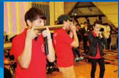
香港傷殘青年協會口琴組表演