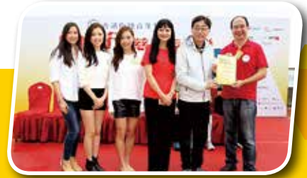
高永文醫生、龐愛蘭太平紳士及三位香港小姐與畢爾比金融(香港)有限公司董事總經理朱國金先生合照