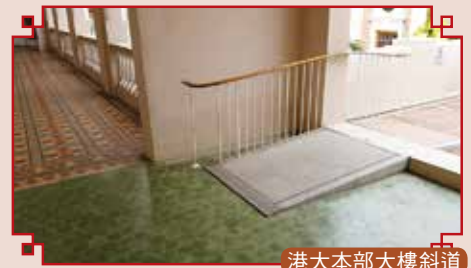
港大本部大樓斜道