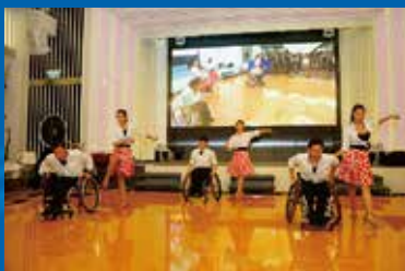
男子團體輪椅舞蹈表演

全賴各位嘉賓、愛心客戶、友好團體、表演單位、義工團體及會員的支持與參與，為是次傷青會的45週年慶祝活動劃上完滿的句號。