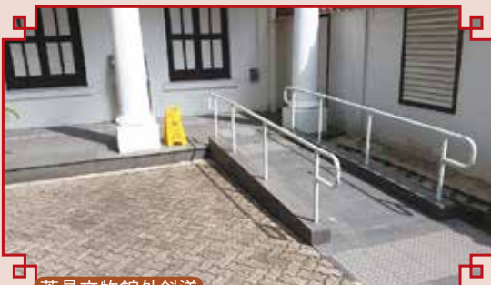
茶具文物館外斜道