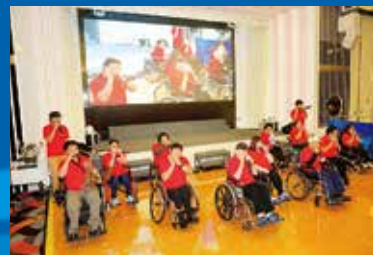
香港傷殘青年協會口琴組表演