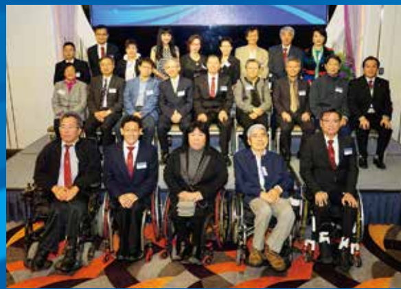
理事會成員與嘉賓大合照