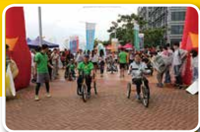
高永文醫生與張偉良主席騎著手動單車帶頭出發