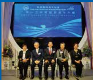
45週年會員大會會議情況

香港傷殘青年協會45週年會員大會暨慈善晚宴已於2015年11月29日(星期日),晚上六時至九時三十分,在九龍灣啟德郵輪碼頭聯邦郵輪宴會中心順利舉行。是次慈善晚宴是傷青會45週年的重點慶祝活動,當晚的活動程序非常緊密和豐富。我們很榮幸邀請到香港特別行政區行政會議召集人林煥光先生GBS,JP及全國人民代表大會常務委員會委員范徐麗泰女士,GBM,GBS,CBE,JP擔任是次週年大會及晚宴的主禮嘉賓。此外,勞工及福利局副局長-蕭偉強先生,JP、社會福利署助理署長-方啓良先生及勞工及福利局康復專員-梁振榮先生,JP亦擔任45週年會員大會的嘉賓,一同見證本會邁向發展的新里程,勉勵本會繼續努力,再接再厲,為會員、為社會作出更多在復康服務上的貢獻。本會理事會主席張偉良先生在超過40位基本會員法定人數下宣佈舉行週年大會,扼要概述本會於過去一年在社區活動、就業服務、歷奇活動、社會企業及康復政策倡議工作上的成果及發展。