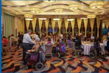
會員參與晚宴情況