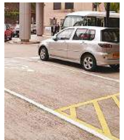
九龍醫院的仍是一般車位