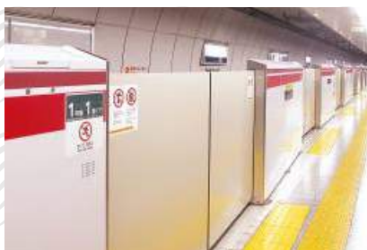
東京地下鐵月台配備視障人士引路徑，亦有工作人員為乘坐輪椅的乘客提供協助。

東京地下鐵大部分車站均設有無障礙通道，殘疾人士如有需要，也可隨時向職員尋求協助，具體流程與香港方面差不多。殘疾乘客需率先在候車大堂告知職員目的地，並指著自己輪椅，向職員說一聲「Slope (斜板)」，職員將會為你作安排。日本地下鐵路職員服務態度相當好，服務效率亦比香港略勝一籌。最重要是沒有「每程只能協助接載一部輪椅」的限制，多位輪椅朋友一同出動也不是問題。