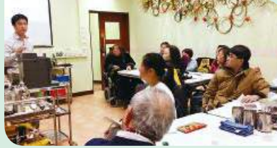
咖啡製作及拉花班