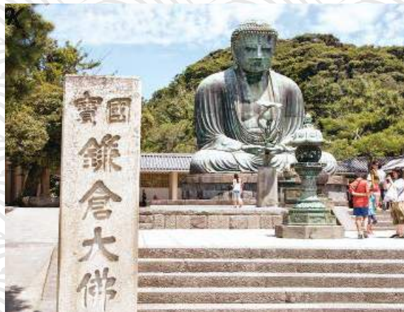
鎌倉景點 - 高德院