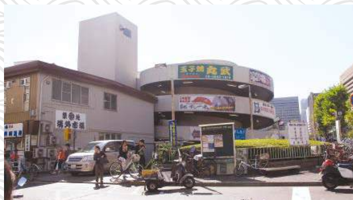
築地市場將於2016年尾前往豐州新址

各位讀者或會問到：在東京有什麼景點值得推介，而又方便殘疾人士前往？筆者曾參觀東京都中央區築地的築地市場，該地距離大江戶線地築地市場站僅咫尺之遙。築地市場佔地23萬平方米，乃東京都政府設立的中央批發市場，亦為日本全國最大的魚市場，以鮪魚競標聞名；市場於平日上午、公眾假期及星期日休市。市場將於2016年底搬遷往豐州的新址。就筆者參觀所見，築地市場通道寬闊，方便乘坐輪椅的殘疾朋友進出，售賣食物種類繁多，海產亦非常新鮮，教人目不暇給。