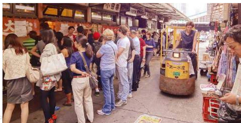
築地市場內通道寬闊，方便殘疾人士進出