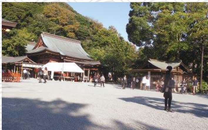
鎌倉景點 - 長谷寺

你有到過外地旅行嗎？到訪過哪些古蹟名勝？可以分享一下籌備過程，和當中的注意事項嗎？當地的無障礙設施情況如何？香港傷殘青年協會現正籌備無障礙旅遊資訊網頁，現誠邀各位會員分享到香港以外地方旅行的經歷，不妨將你暢遊各地的經歷，連同相關圖片、影片傳送至 bfintour@gmail.com 。