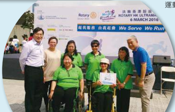
扶輪香港超級馬拉松