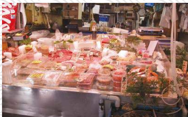
築地市場乃全國最大魚市場，售賣海產種類繁多