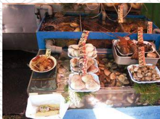
市場售賣的海產生猛鮮活