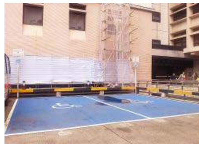
伊利莎伯醫院設有藍底白字車位

駕駛會近年積極推動政府把轄下設施內的殘疾人士泊車位使用藍底白字,以方便辨識。現時政府場所內殘疾人士泊車位在進行翻新工程後大多會採用藍底白字。為了進一步推廣有關安排,駕駛會會爭取公立醫院參照政府部門的做法,以便利往來醫院的殘疾人士。