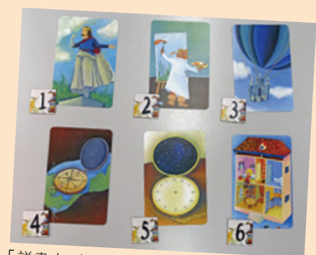
「說書人」說主題是「童話」，你知道他是出哪一張牌嗎？