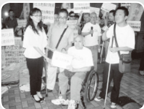
聯席成員向九巴代表遞交請願信

聯席多年來一直要求各間巴士公司為殘疾人士提供交通半費優惠，只可惜他們不斷以經營困難為由推搪。事實上，今年載通(九巴母公司)公佈2010年全年業績，除稅後盈利高達8.67億港元，盈利增幅近29%，實有充份條件提供半價優惠。九巴過去亦不斷把車廠地皮改變為地產用地出售，藉此賺取豐厚利潤，卻沒有因此回饋社會，在錄得鉅額盈利的情況下仍申請加價，罔顧民生，令人氣憤。