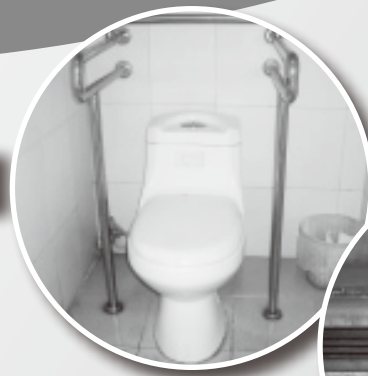
有待改善的 殘疾人士洗手間

為此，政策倡導主任與中心經理於2011年4月至5月期間，到鹽田區進行一共4次的無障礙設施巡查工作，以促進鹽田區無障礙設施的發展。這次調查主要檢視區內一共9個重點殘疾人士個案，並前往他們日常到達的建築物及通道設施作實地了解，當中包括屋苑、商場、郵政局、圖書館等建築物，藉此了解不同個案的日常生活需要及鹽田區內無障礙設施的情況，並就有關設施不足之處提出改善建議。本會冀望這次調查能有助把香港推行無障礙建設的經驗與內地相關部門作交流分享，從而推動兩地無障礙社區的建設。