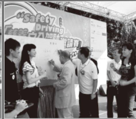
嘉賓簽署安全約章

第一渡輪服務有限公司、新世界第一巴士服務有限公司城巴有限公司、香港迪士尼樂園、山頂纜車有限公司、香港杜莎夫蠟像館、天行集團、恒生銀行有限公司和香港中華煤氣有限公司等。