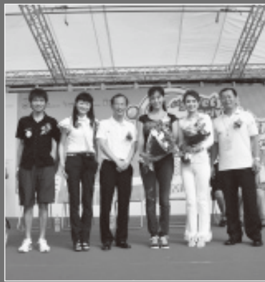
主禮嘉賓曾鈺成先生致送花束予名人賽參賽者