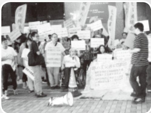
聯席召集人在請願行動上發言