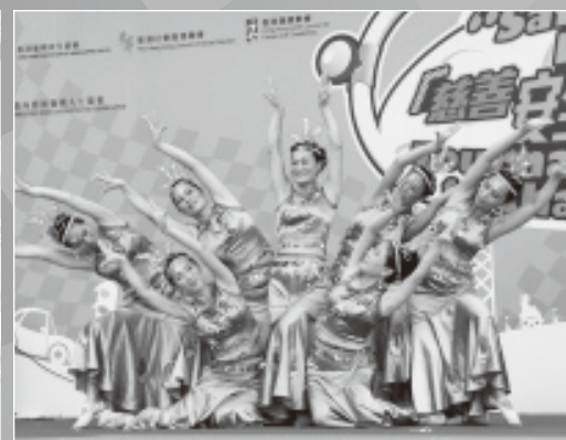
彩雲社區服務協進會暨雲滋舞蹈團一表演月光下的鳳美竹