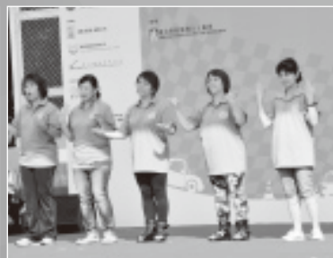
香港聾人協進會表演手語