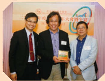
▪ 信佳集團管理有限公司