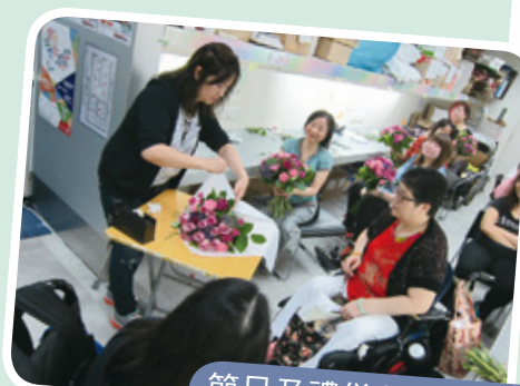
節日及禮儀花藝設計基礎證書（兼讀制） 花藝設計及應用 I 基礎證書（兼讀制）