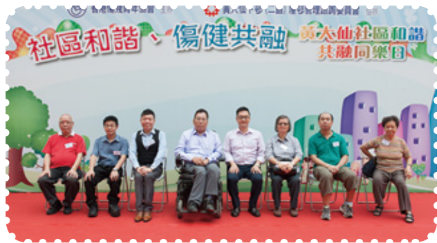
主禮嘉賓及嘉賓大合照