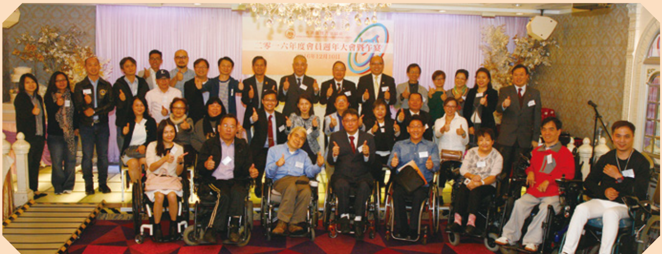
▪ 週年大會及午宴嘉賓、理事及委員大合照