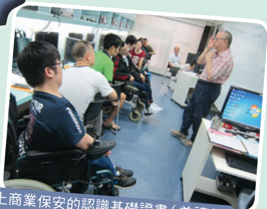
網上商業保安的認識基礎證書（兼讀制）