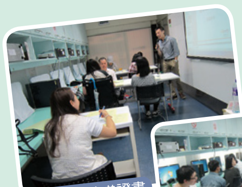
實用文職訓練基礎證書