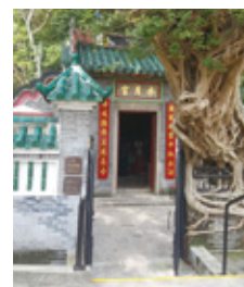
公園內有一座百年歷史的水月宮古廟，但門外設有梯級，並不方便輪椅使用者