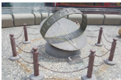
園內日晷可供遊客了解時間