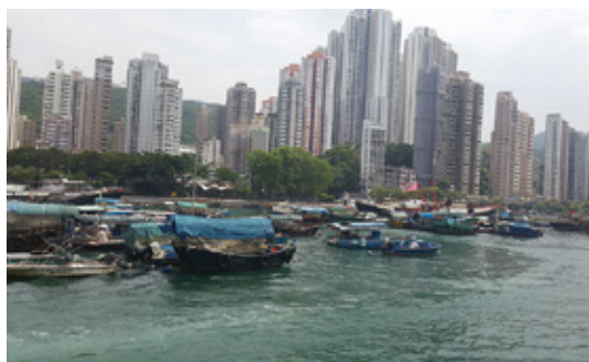
遊客可沿海濱長廊步行觀賞香港仔避風塘風景

大家可經由利東港鐵站A2出口(該出口通道為一條頗長的斜道，且中間沒有平台可供輪椅使用者停泊休息，手動輪椅使用者要特別注意)出站後，沿華庭街往香港仔海灣方向往前行(該處下斜路緣不足，建議輪椅使用者可從華庭街靠市政大廈側道路前往)，便會到達鴨脷洲風之塔公園，風之塔公園位於鴨脷洲北岸海旁，佔地2.62公頃，耗資1億港元興建，沿路進入風之塔公園之前，會經過鴨脷洲海濱長廊，遊客可先沿海濱長廊慢步觀看香港仔避風塘風景，長廊中設有不少模型漁船、龍舟等，如果喜歡龍舟的朋友一定會喜歡這裡。