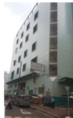
鴨脷洲市政大廈內設有街市、熟食中心及體育館，分別設有不同的無障礙進出口，輪椅使用者可按需要從不同的進出口入內