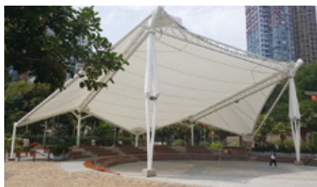
公園內的廣場，說不定會遇有表演節目欣賞