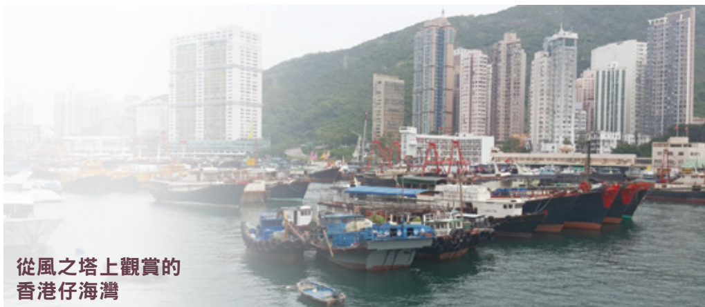
從風之塔上觀賞的香港仔海灣

位於香港島南區香港仔對開的鴨脷洲，與香港仔及黃竹坑僅一橋之隔，甚至步行可達。鴨脷洲的「脷」字，在粵語中是舌頭的意思，因其形狀狹長像鴨舌而得名。隨著港鐵南港島線於去年底通車，大家前往鴨脷洲又多了一個快捷方便的途徑，倘週末有時間的話，不妨可以去鴨脷洲逛逛。