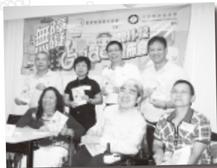
委員會成員與嘉賓們合照

委員會於2008年獲勞工及福利局贊助，推行「實踐無障礙旅遊」計劃，旨在倡導社會大眾關心殘疾人士外出旅遊時的需要和困難，並喚起各社會團體和機構認同「無障礙旅遊」的理念。「無障礙旅遊」是指任何人士，包括殘疾人士、長者和孕婦等，都能輕鬆自如地到達各旅遊景點遊覽，並使用景點內的所有設施。本計劃得到多間學校和社區團體的支持，派出義工與本會殘疾會員，共同前往香港多個旅遊景點進行實地測試，以了解香港不同旅遊景點的無障礙情況。