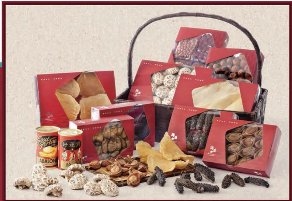
本公司專營直接原產地進口，地球牌魚凍環球海產，鴻運牌日本乾鮑、曬鮑、鮑參翅肚、參茸燕窩。