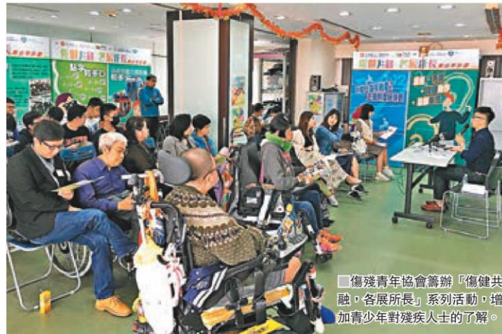
傷殘青年協會籌辦「傷健共融，各展所長」系列活動，增加青少年對殘疾人士的了解。

一方面反映現時青少年對殘疾人士的關注和認識比過往已有所增加；而如何與殘疾人士相處、體會和理解殘疾人士在日常生活遇到的困難及挑戰等，則仍需要繼續相關的教育工作，以讓青少年能加深對殘疾人士的了解，及對殘疾人士的不同能力有正確認識，推動年輕一代實踐平等共融。