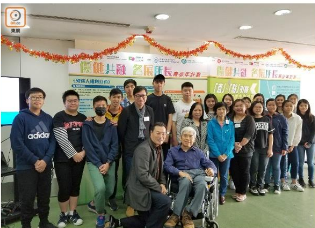
團體收集中小學生對傷殘人士的30個常見疑問。

「是否聾就會啞？」、「視障人士怎樣辨認男女廁所？」，青少年對殘疾人士的疑問及誤解多。為提升青少年對殘疾人士權利及需要的了解，由勞工及福利局主辦、香港傷殘青年協會(傷青會)籌辦的「傷健共融，各展所長」青少年計劃去年九月至本月走訪逾50間中小學及大