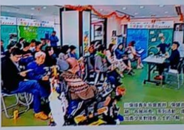
「健體共融·各展所長」健體共融青少年計劃，讓青少年親身接觸及體驗殘疾人士的日常生活。

她在計劃中走訪各間中小學進行分享，向青少年講解自己怎樣面對困難。希望讓他們明白即使自己是殘疾人士亦同樣擁有與健全人士一樣的權利和責任。人人平等，她很高興遇上有人積極溝通，但認識殘疾人士亦不會感到難受。在學入學可以將殘疾人士當做普通人看待。 僑青會於學校舉行教育工作期間，收集並總結超過1000份中小學生對殘障、聽障及對殘疾人士的印象意見。發現他們對殘疾人士普遍有誤解。 「過去反映視障青少年對殘疾人士的關注和認識比過往已有所增加，但就如何與殘疾人士相處、體會和理解殘疾人士在日常生活遇到的困難及挑戰等，仍有高要繼續相關的教育工作。讓青少年能更深對殘疾人士的了解，這對殘疾人士的不同能力有正確認識，有助年輕一代消除平等誤解。」