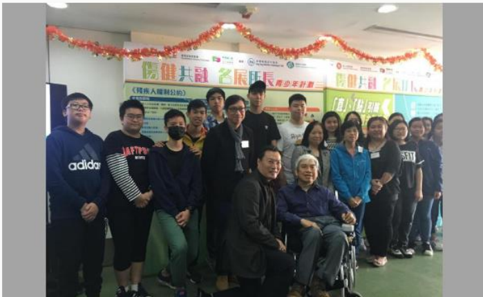
傷青會走訪多間學校收集青年對殘疾人士疑問

勞工及福利局聯同香港傷殘青年協會，在去年9月至今年2月，合辦傷健共融青年教育活動，走訪多間中小學，並收集超過1000名中小學生，對視障、聽障及肢體傷殘人士，最常見的30個疑問，包括視障人士如何辨別男女廁、是否聾就會啞，和輪椅人士如何坐飛機等，協會認為結果顯示不少青少年對殘疾人士有誤解，但認識已比以往有所增加，會向政府反映跟進，並推動青年教育和改善傷殘友善設施。